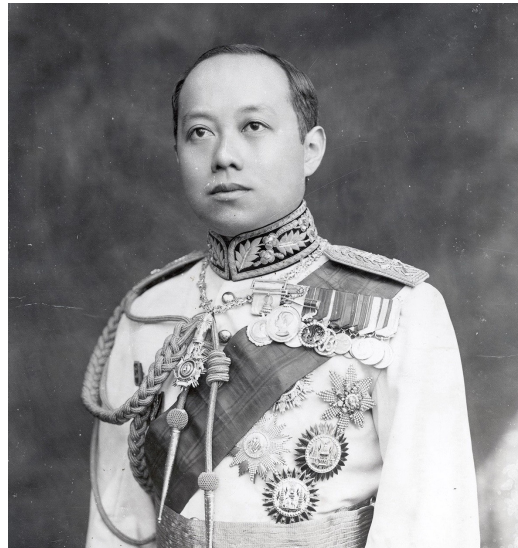
พระบาทสมเด็จพระมงกุฎเกล้าเจ้าอยู่หัว รัชกาลที่ ๖

งบประมาณของกองทัพเรือที่ต้องได้รับการพิจารณา และผ่านจากรัฐสภา มีมาตั้งแต่ประเทศชาติเริ่มเป็น ประชาธิปไตย กล่าวคือในปี พ.ศ.๒๔๗๘ รัฐสภา ได้ออกพระราชบัญญัติ “บำรุงกำลังทางเรือ” ทำให้ กองทัพเรือได้เรือปืนหนัก เรือสลูบ เรือตอร์ปิโดใหญ่/ เล็ก เรือดำน้ำ เรือวางทุ่นระเบิด และเรือลำเลียง จากประเทศญี่ปุ่นและอิตาลี ในปี พ.ศ.๒๔๗๙ มีพระราชบัญญัติ “บำรุงกำลังกองทัพสยาม” เป็น งบประมาณ ๒๔ ล้านบาท ในเวลา ๕ ปี ซึ่งแบ่งเป็น ของกองทัพบก ๖ ล้าน กองทัพเรือ ๑๒ ล้านบาท และ กรมอากาศยาน (ต่อมาเป็นกองทัพอากาศ) ๖ ล้านบาท