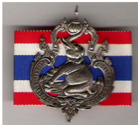
เข็มราชนาวีสมาคมแห่งกรุงสยาม รุ่น ๒ ด้านหลังเปลี่ยนสีแพรแถบเป็นธงไตรรงค์