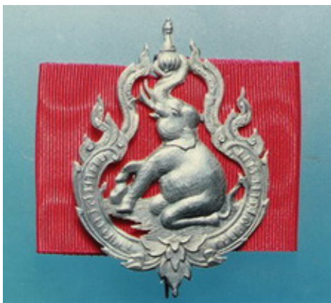
เข็มราชนาวีสมาคมแห่งกรุงสยาม รุ่นแรก ด้านหลังสอดแพรแถบสีแดง

ไว้ป้องกันประเทศ ต่อมาพระบาทสมเด็จพระมงกุฎเกล้าเจ้าอยู่หัว ทรงพระราชทานทรัพย์ส่วนพระองค์ จำนวน ๘ หมื่นบาท และมีพระบรมวงศานุวงศ์ ข้าราชการ พ่อค้า ประชาชน ร่วมบริจาคเงินซื้อเรือรบเป็นอันมากจนได้เงินถึง ๓,๕๑๔,๖๐๔ บาท จนปี พ.ศ.๒๔๖๓ นายพลเรือโทพระเจ้าพี่ยาเธอ กรมหมื่นชุมพรเขตอุดมศักดิ์ (พระยศในขณะนั้น) ได้รับพระมหากรุณาธิคุณโปรดเกล้าฯ ไปจัดหาซื้อเรือรบยังทวีปยุโรป ปรากฏว่าพระองค์ได้เสด็จฯ ไปทรงเลือกซื้อเรือรบที่ประเทศอังกฤษ และทรงเลือกซื้อเรือเรเดียนท์ ซึ่งเป็นเรือประเภทพิฆาตตอร์ปิโดอันเหมาะสมกับประเทศไทย เมื่อทรงซื้อเรือและตรวจรับเรียบร้อยแล้ว จึงทรงนำเรือรบลำนี้ ซึ่งก็คือ เรือรบพระร่วง เดินทางจากอังกฤษมาสู่ประเทศไทย โดยสวัสดิภาพ เมื่อวันที่ ๗ ตุลาคม พ.ศ.๒๔๖๓ (วารสารหลักเมือง พุศจิกายน พ.ศ.๒๕๕๗)