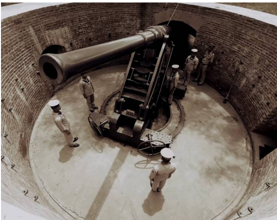
ปืนเสือหมอบ

อภิปรายเรื่องใด ประเด็นใดก็เป็นประโยชน์แก่ทหารเรือ นอกจากเพื่อนทหารเรือในรัฐสภาแล้ว มีหลายประเทศที่มีสมาคมหรือสโมสร หรือชมรมเรียกว่า Navy League อย่างในสหรัฐอเมริกา อังกฤษ แคนาดา เยอรมัน สิงคโปร์ ฯลฯ ที่ประชาชนสนใจ สนับสนุนเป็นสมาชิก และร่วมกิจกรรมกับทหารเรือ บางแห่งมีการฝึกสมุทรเสนาแก่เด็ก ๆ ลงเรือไปดูการปฏิบัติงานในเรือที่สำคัญ การจัดตั้งลีก ตั้งอย่างเป็นทางการ เช่น Navy League สหรัฐอเมริกา ตั้งโดยการริเริ่มของประธานาธิบดี รูสเวลท์(Theodore Roosevelt) ใน พ.ศ.๒๔๔๕ เป็นต้น งานของลีกอย่าง League of Canada มีการฝึกสมุทรเสนา (Sea Cadets) และให้ความรู้ทางสมุทรภาพแก่สมาชิกและสาธารณชน ซึ่งลีกในต่างประเทศปัจจุบัน มีความมุ่งหมายต่างจากราชนาวีสมาคมแห่งกรุงสยาม ที่มุ่งในการจัดหาเรือรบ แต่ก็ เป็น “เพื่อนทหารเรือ” เหมือนกัน