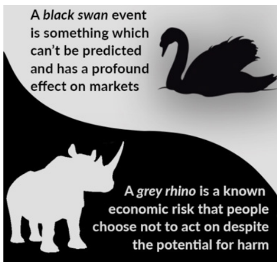
ภาพที่ ๓ หงส์ดำ (Black Swan) และแรดเทา (Grey Rhino)

World Trade Center ที่สหรัฐอเมริกา หรือเมื่อวันที่ ๑๑ มีนาคม พ.ศ.๒๕๕๔ เหตุการณ์ระเบิดของโรงไฟฟ้านิวเคลียร์ เพราะแผ่นดินไหว และคลื่นยักษ์สึนามิ ที่ Fukushima ประเทศญี่ปุ่น เป็นต้น สำหรับเหตุการณ์ที่มีความเสี่ยงที่จะเป็นแรดเทาในปี พ.ศ.๒๕๖๒ ตามความเห็นของ Michele Wucker เช่น ความตึงเครียดระหว่างสหรัฐอเมริกากับจีน สงครามไซเบอร์ และการตกต่ำด้านเศรษฐกิจโลก เป็นต้น