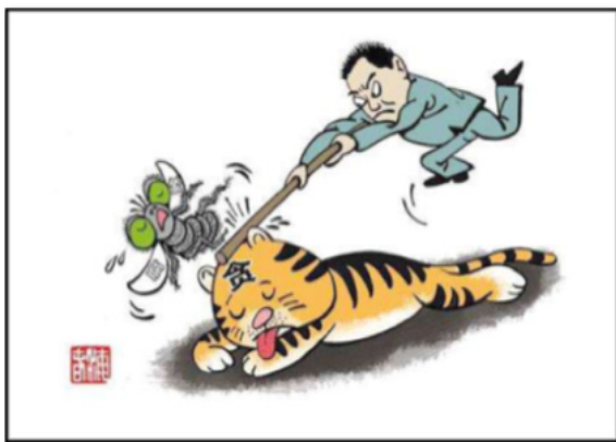
ภาพที่ ๘ ยุทธการตีเสือและแมลงวันไปพร้อมกันของ สี จิ้นผิง

มาตลอดว่า จะพยายามปรับปรุงคุณภาพชีวิตของประชาชน แก้ไขปัญหา และพัฒนาเศรษฐกิจของประเทศ และที่สำคัญที่สุด คือ การกวาดล้างพฤติกรรมทุจริตทุกรูปแบบในหมู่ข้าราชการ เพื่อเสริมสร้างภาพลักษณ์การเป็นรัฐบาล “มือสะอาด” จึงได้กำหนดนโยบายที่รู้จักกันโดยทั่วไปว่า “ยุทธการตีเสือ และแมลงวันไปพร้อมกัน” (ดูภาพที่ ๘ ยุทธการตีเสือ และแมลงวันไปพร้อมกันของ สี จิ้นผิง) ถึงแม้จะมีหลายฝ่ายวิจารณ์ว่า เป็นการละเมิดสิทธิ และมีเป้าหมายซ่อนเร้น เพื่อปราบศัตรูทางการเมือง แต่ทุกคนก็รู้จักและยอมรับว่า เสือที่ถูกตีแต่ละคนนั้นก็โกงกินชาติจริง ๆ และนโยบายนี้เป็นที่ถูกต้อง และได้รับความชื่นชมจากประชาชนทั่วไปอย่างสูง