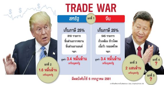
ภาพที่ ๕ สงครามการค้าระหว่างสหรัฐฯ กับจีน

นี้มีผลทำให้จีนต้องปรับพฤติกรรมการค้า ภายในไม่กี่เดือนข้างหน้าก็คงจะเห็นกันว่าจะสามารถปฏิบัติได้จริงหรือไม่ และการที่สหรัฐฯ คงอัตราภาษีที่เก็บเพิ่มจากสินค้าจีนบางส่วนเอาไว้ ก็เพื่อให้รัฐบาลสหรัฐฯ มีเครื่องมือเอาไว้บังคับใช้ข้อตกลงต่อไป ทั้งนี้คาดว่าจะสามารถเริ่มการเจรจาเพื่อจัดทำข้อตกลงการค้าเฟส ๒ ก่อนที่จะมีการเลือกตั้งประธานาธิบดีสหรัฐฯ ในต้นเดือนพฤศจิกายน พ.ศ.๒๕๖๓ ซึ่งสงครามการค้าระหว่างสหรัฐฯ กับจีนนี้ ส่งผลกระทบต่อทุกประเทศทั่วโลก เนื่องจากการขยายตัวของเศรษฐกิจโลกในภาพรวมชะลอตัวลง โดยเฉพาะอย่างยิ่งประเทศที่พึ่งพาการส่งออกไปยังสองประเทศนี้ได้รับผลกระทบหนัก ยอดการส่งออกลดลงจนส่งผลต่ออัตราการขยายตัวของประเทศเหล่านั้นตามไปด้วย สุดท้ายแล้ว แม้แต่ประเทศที่ไม่ได้พึ่งพาการส่งออกไปยังสหรัฐฯ และจีน ก็จะได้รับผลกระทบทางอ้อมจากการที่เศรษฐกิจของประเทศอื่นชะลอตัวลงตามไปด้วย และเนื่องจากทั้งสองประเทศเป็นคู่ค้ารายใหญ่ของประเทศไทย สงครามการค้าที่ยืดเยื้อจึงส่งผลต่อเศรษฐกิจไทยอย่างหลีกเลี่ยงไม่ได้