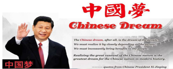
ภาพที่ ๙ จงกั๋ว เม็ง หรือความฝันของจีน

โดยในช่วง ๕ ปีที่ผ่านมา (ปี พ.ศ.๒๕๕๖ - พ.ศ.๒๕๖๐) จีนได้ดำเนินการตามขั้นตอนเพื่อตามความฝันของจีนให้สำเร็จบ้างแล้ว มีประชาชนจีนเฉลี่ยปีละ ๑๔ ล้านคน หลุดพ้นจากความยากจนแล้ว คนยากจนในที่นี่ หมายถึง คนที่มีรายได้ ๒,๘๐๐ หยวน หรือประมาณ ๑๔,๐๐๐ บาท ต่อปีหรือเพียงวันละ ๓๘ บาท ซึ่งตัวเลขนี้ต่ำกว่าเกณฑ์