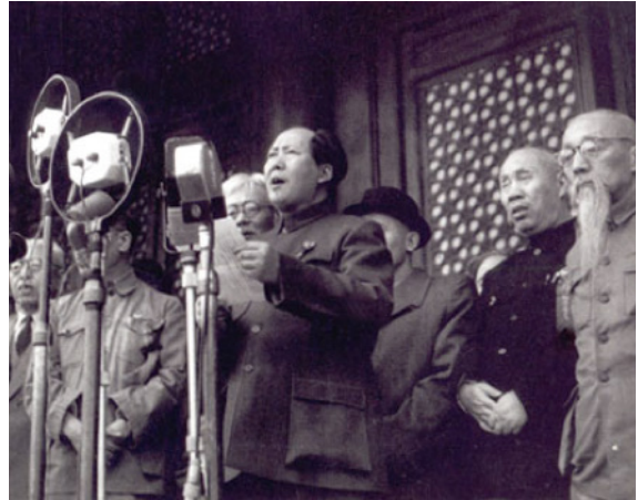
ภาพที่ ๗ เหมา เจ๋อตุง ประกาศตั้งสาธารณรัฐประชาชนจีน ที่จัตุรัสเทียนอันเหมิน

ขึ้นที่จัตุรัสเทียนอันเหมิน) นับตั้งแต่นั้นมาจีนก็เริ่มก้าวเดิน จนเป็นอย่างที่เราเห็นอยู่ในปัจจุบัน