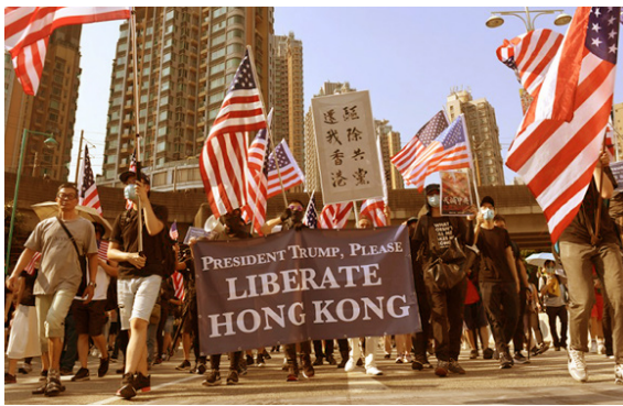
ภาพที่ ๖ การประท้วงในฮ่องกง

ร่างกฎหมายนี้ไม่มีกำหนด ขณะที่ฝ่ายสหรัฐฯ เมื่อต้นเดือนพฤศจิกายน พ.ศ.๒๕๖๒ นายโดนัลด์ ทรัมป์ ประธานาธิบดีสหรัฐฯ ได้ลงนามในกฎหมาย ๒ ฉบับ ที่เกี่ยวข้องกับการสนับสนุนประชาธิปไตย และสิทธิมนุษยชน ในฮ่องกง หลังจากสภาผู้แทนราษฎรสหรัฐฯ สนับสนุนกฎหมายดังกล่าวอย่างท่วมท้น โดยกฎหมายฉบับแรก กำหนดให้กระทรวงการต่างประเทศสหรัฐฯ ต้องพิจารณารับรองอย่างน้อยปีละ ๑ ครั้ง ว่าฮ่องกงมีอิสระเพียงพอหรือไม่ในการปกครองตนเอง เพื่อแลกกับสิทธิพิเศษทางการค้าจากสหรัฐฯ ส่วนกฎหมายอีกฉบับเกี่ยวกับการสั่งห้ามขายอาวุธควบคุมฝูงชนให้กับตำรวจฮ่องกง ด้านกระทรวงการต่างประเทศจีน ประกาศกร้าวเตือนให้สหรัฐฯ เตรียมรับผลกระทบจากมาตรการตอบโต้ของจีน สำหรับประเทศไทยสามจังหวัดชายแดนภาคใต้ ปัญหาการแบ่งแยกดินแดนอาจเป็นส่วนหนึ่งที่ไทยต้องใช้ความระมัดระวังในการแก้ปัญหา โดยเฉพาะในประเด็นการถูกแทรกแซงจากต่างชาติ และองค์กรต่าง ๆ