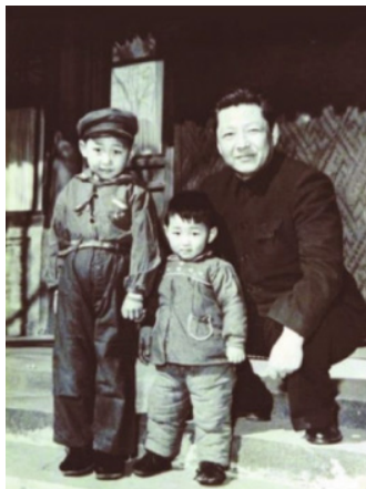
ภาพที่ ๑ นาย สี จงซุน บิดาประธานาธิบดี สี จิ้นผิง

ทั้งสามคำนี้ไม่ใช่วาทะ หรือนโยบายของ สี จิ้นผิง แต่ผู้เขียนคิดว่าเป็นคำสอนที่มีความสำคัญต่อประธานาธิบดี สี จิ้นผิง เป็นอย่างมาก เพราะถือเป็นต้นกำเนิดแนวความคิด และการปฏิบัติ คำกล่าวทั้งสามคำนี้แท้จริงแล้วเป็นคำสอนของนาย สี จงซุน บิดาของสี จิ้นผิง (ดูภาพที่ ๑ นายสี จงซุน บิดาของประธานาธิบดี สี จิ้นผิง) ที่ได้สั่งสอนไว้ เรียกว่า “บทเรียน ไช่สามใบ”