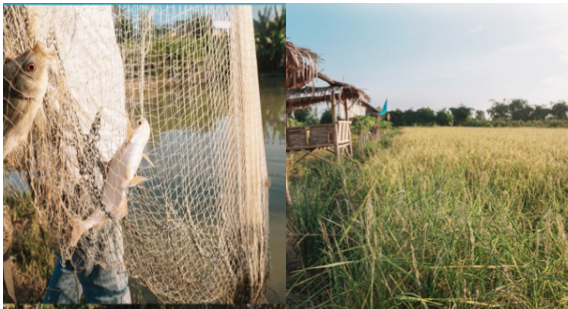
ภาพที่ ๔ ในน้ำมีปลา ในนามีข้าว

โลกลดลง จากข้อมูลของสถาบันวิจัยเพื่อการพัฒนาประเทศไทย (TDRI) พบว่า เมื่อปี พ.ศ.๒๕๐๔ ไทยมีป่าไม้ ร้อยละ ๕๓.๓๓ ปี พ.ศ.๒๕๔๑ ร้อยละ ๒๕.๒๘ ปี พ.ศ. ๒๕๕๗ ร้อยละ ๓๑.๖๒ ปี พ.ศ.๒๕๕๘ ร้อยละ ๓๑.๖๐ และปี พ.ศ.๒๕๕๙ ร้อยละ ๓๑.๕๘ ปริมาณฝนตก จากประมาณ ๑๐๐ กว่าวันต่อปี ก็มีแนวโน้มลดลงเกือบ ทุกภาค หากประเทศไทยไม่สามารถฟื้นฟูป่าไม้ได้ ในเร็ววันนี้ เด็กรุ่นหลังคงเพียงได้ยินได้ฟังคำว่า “ ในน้ำมีปลา ในนามีข้าว ” จากภาพถ่ายหรือภาพวาด แต่ไม่มีโอกาส ได้เห็นภาพจริงอีกต่อไปแล้วในอนาคต