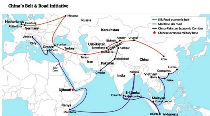
ภาพที่ ๑๐ China’s Belt & Road Initiative

ของมนุษยชาติ ในฐานะเป็นเส้นทางโบราณในการติดต่อค้าขาย และสื่อสารระหว่างตะวันออกกับตะวันตก คำว่า “ เส้นทางสายไหม ” กลับมาได้รับความสนใจอีกครั้งหนึ่งในเดือน กันยายน พ.ศ.๒๕๕๖ เมื่อประธานาธิบดี สี จิ้นผิง (ในคราวไปเยือนคาซัคสถาน) ได้แถลงการริเริ่มโครงการ “ แถบเศรษฐกิจเส้นทางสายไหม ” ที่ประกอบด้วยเครือข่ายถนน และเส้นทางรถไฟเชื่อมจีนกับยุโรปผ่านเอเชียกลาง ต่อมาในเดือนตุลาคม ปีเดียวกัน (ในคราวไปเยือนอินโดนีเซีย) ประธานาธิบดี สี จิ้นผิง ได้กล่าวเปิดตัวโครงการ “ เส้นทางสายไหมทางทะเล ” ที่เชื่อมท่าเรือจีนกับท่าเรือในเอเชียตะวันออกเฉียงใต้ เอเชียใต้ ตะวันออกกลาง และยุโรป ตลอดเส้นทางบกและเส้นทางทะเลจะมีการลงทุนปรับปรุงท่าเรือ และสร้างศูนย์การผลิตอุตสาหกรรมและการค้าขึ้นมา โครงการเครือข่ายเส้นทางสายไหมทางบก และทางทะเลนี้มีชื่อเรียกอยู่หลายอย่าง เช่น การริเริ่มแถบและเส้นทาง (Belt and Road Initiative) หรือหนึ่งแถบ หนึ่งเส้นทาง (One Belt, One Road) โครงการเส้นทางบกมีชื่อเป็นทางการว่า “ แถบเศรษฐกิจเส้นทางสายไหม ” (Silk Road Economic Belt : SREB) ส่วนเส้นทางมหาสมุทร เรียกว่า “ เส้นทางสายไหมทางทะเล ” (Maritime Silk Road) โครงการเส้นทางสายไหมทั้งหมด หรือโครงการเส้นทางสายไหมในศตวรรษที่ ๒๑ นี้ (ดูภาพที่ ๑๐ China’s Belt & Road Initiative) จะใช้เงินลงทุนราว ๑.๔ ล้านล้านดอลลาร์เกี่ยวข้องกับ ๗๐ ประเทศ ครอบคลุมประเทศต่าง ๆ ใน