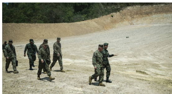
การตรวจภูมิประเทศเตรียมการประชุมวางแผนขั้นต้น จะดำเนินการก่อนหรือระหว่างการประชุม IPC

๑.๔ การตรวจภูมิประเทศเตรียมการประชุมวางแผนขั้นต้น (Initial Site Survey : ISS) ใช้เวลา ๖ วัน ห้วงสัปดาห์สุดท้ายของเดือนกรกฎาคม เพื่อให้เจ้าหน้าที่ฝ่ายไทยเดินทางตรวจภูมิประเทศเพื่อรวบรวมข้อมูลเตรียมการประชุมวางแผนขั้นต้น