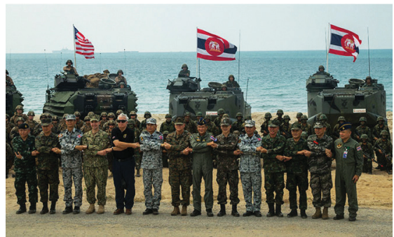
การฝึกการยุทธสะเทินน้ำสะเทินบก หนึ่งในภารกิจที่เป็นสัญลักษณ์ ของการฝึก COBRA GOLD

การฝึกภาคสนาม การประชุมเพื่อเตรียมจัดการฝึก ต่าง ๆ รวมถึงการเป็นล่าม และผู้บรรยายในการฝึก ดำเนินกลยุทธ์ด้วยกระสุนจริง จึงอยากจะใช้บทความนี้ เป็นเครื่องมือถ่ายทอดองค์ความรู้ และประสบการณ์ ที่ได้รับจากการฝึก รายละเอียดการฝึก รวมถึงการ เตรียมการต่าง ๆ ในวงรอบการฝึก COBRA GOLD แต่ละครั้ง เพื่อให้ผู้อ่านได้มีความเข้าใจการฝึก COBRA GOLD มากยิ่งขึ้น