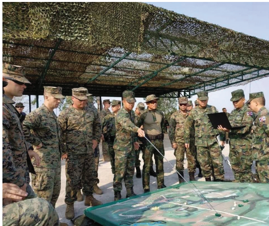
การสำรวจพื้นที่เพื่อจัดโครงการ ENCAP

มักจะให้ฝ่ายไทยเป็นผู้นำ (Lead) ระดับยุทธการ ในการฝึก COBRA GOLD โดยเฉพาะการฝึก CPX หรือ STAFFEX นั้น เป็นการฝึกการวางแผน ระดับยุทธการ ทำให้ได้ประโยชน์จากการร่วมกันวางแผนต่าง ๆ เนื่องจากเป็นการฝึกที่มีกำลังพลมาจากหลาย ๆ เหล่าทัพ และหลาย ๆ ประเทศ ทำให้สามารถเก็บเกี่ยวความรู้ ทักษะคติในการวางแผน ตลอดจนสามารถเรียนรู้หลักนิยมทางทหารจากชาติที่เข้าร่วมการฝึกได้อีกด้วย