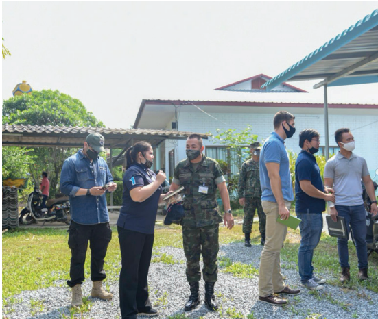
การสำรวจพื้นที่เพื่อจัดโครงการ ENCAP

และอัครศิภย สถานีอุทกภย สถานีดินถล่ม และการบริการทางการแพทย