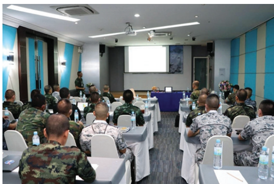
การฝึก Pre STAFFEX

๑.๙.๑ การฝึกเตรียมความพร้อม การฝึกปัญหาที่บังคับการ ครั้งที่ ๑ (Pre CPX 1)/ การฝึกการแก้ปัญหาฝ่ายอำนวยการ (Pre STAFFEX1) จัดก่อนการฝึกปัญหาที่บังคับการ/การฝึกปัญหา ฝ่ายอำนวยการ การฝึกคอบร้าโกลด์ ๑ เดือน ที่สำนึก วางแผนฝึกร่วมผสม กรมยุทธการทหาร โดยเป็นการ ฝึกเตรียมการเฉพาะฝ่ายไทย