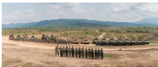
การฝึก CALFEX ณ พื้นที่สนามฝึก ทร. หมายเลข ๑๖ บ้านจันทม

- การฝึกภาคสนามทางไซเบอร์ (Cyber FTX) เป็นการฝึกในระบบจำลองการปฏิบัติการทางไซเบอร์