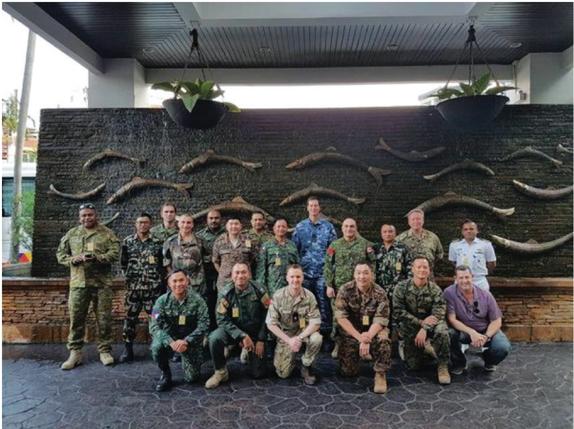
ผู้เข้าร่วมการฝึกในส่วน MPAT จากชาติต่าง ๆ

กองทัพไทย และกองทัพสหรัฐอเมริกาได้เริ่มการฝึกร่วม/ผสม ภายใต้รหัส “คอบร้าโกลด์” ในปี พ.ศ. ๒๕๒๕ ครั้งนั้นกองทัพเรือไทย และกองทัพอากาศไทย จัดกำลังเข้าร่วมการฝึก โดยดำเนินการฝึกปฏิบัติการทางเรือ ปฏิบัติการทางอากาศ และการยกพลขึ้นบก ร่วมกับกองทัพเรือ และนาวิกโยธินสหรัฐอเมริกา กำหนดรหัสว่า “คอบร้าโกลด์ ๘๒” (ค.ศ.๑๙๘๒)