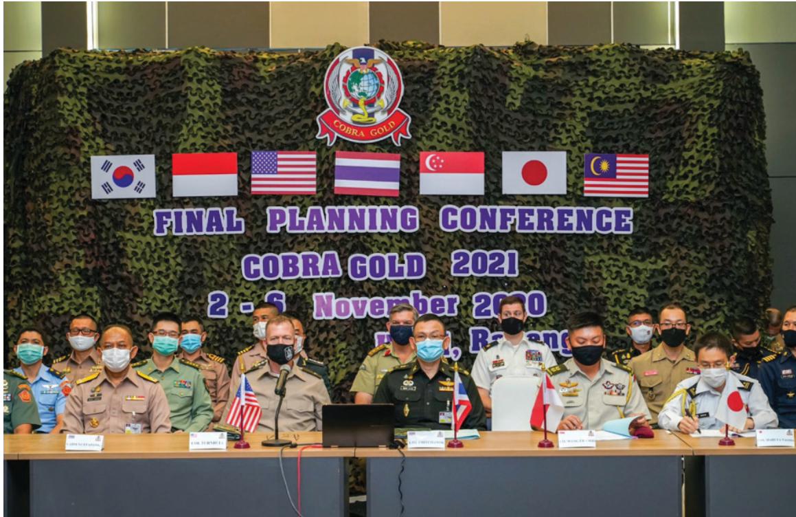
การประชุมวางแผนขั้นต้น COBRA GOLD 2021

๑.๕ การประชุมวางแผนขั้นต้น (Initial Planning Conference : IPC) หัวข้อสัปดาห์แรกของเดือนสิงหาคม ใช้เวลา ๕ วัน ประกอบด้วยกิจกรรมคือ การประชุมจัดทำอัตรากำลังพลขั้นต้น การประชุมพัฒนาลำดับเหตุการณ์หลัก กำหนดการสำคัญต่าง ๆ เพื่อเตรียมการฝึกคอบร้าโกลด์ เมื่อเสร็จการประชุมจะต้องรายงานผลการประชุมพร้อมกับการขออนุมัติคำสั่งการฝึกคอบร้าโกลด์ต่อผู้บัญชาการทหารสูงสุด ซึ่งในคำสั่งการฝึกคอบร้าโกลด์ประกอบด้วย วัตถุประสงค์การฝึก แนวทางในการจัดการฝึก โครงสร้างการจัดกองอำนาจการฝึก และกำหนดการฝึกหลัก