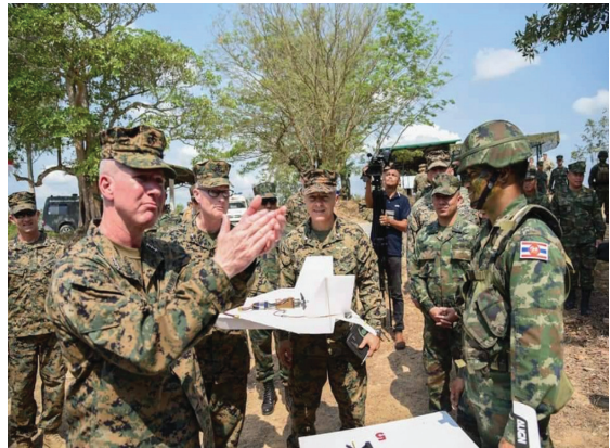
ช่วงเวลาในแต่ละกิจกรรมของการฝึก COBRA GOLD 21

อีกมุมมองหนึ่งนั้น การฝึก COBRA GOLD เป็นการนำเอาความรู้ เทคโนโลยี รวมถึงหลักนิยมใหม่ ๆ