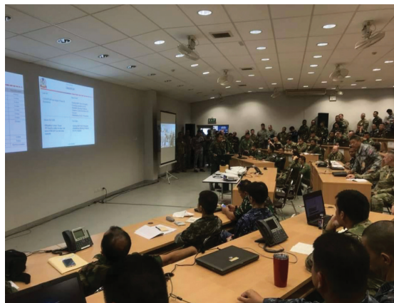
การฝึกการแก้ปัญหาที่บังคับการ (CPX)

ฝ่ายอำนวยการ การฝึกคอบร้าโกลด์ ๑ สัปดาห์ ณ สถานที่ฝึกที่กำหนด โดยเป็นการฝึกร่วมกันทั้งฝ่ายไทย และฝ่ายสหรัฐอเมริกา ซึ่งเป็นเจ้าภาพหลักของการฝึก