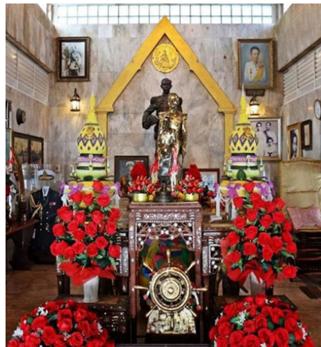
พระรูปหล่อเสด็จในกรมฯ ในพระตำหนักที่หาดทรายรี จังหวัดชุมพร

ที่เป็นข้อยกเว้นให้นำคำว่า “ตำหนัก” และ “พระตำหนัก” ไปใช้เป็นคำเรียกชื่อปูชนียสถานที่ประดิษฐานพระรูปเขียน พระรูปปั้น หรือพระรูปหล่อเจ้านาย และสมเด็จพระ พระสังฆราช “ซึ่งสิ้นพระชนม์แล้ว” ๗ หรือนำคำว่า “พระตำหนัก” ไปใช้เรียกชื่อปูชนียสถานที่ประดิษฐาน พระบรมรูปปั้น หรือพระบรมรูปหล่อพระบูรพมหากษัตริย์ หรือพระมหากษัตริย์ “ซึ่งเสด็จสวรรคตแล้ว” ได้อย่างใด เช่นกัน