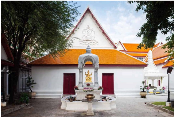
เทวาลัย เทวสถาน หรือเทวาวาสที่เป็นโบสถ์พราหมณ์

ตั้งข้อสังเกต และวิเคราะห์คำตอบที่สมเหตุสมผลมากที่สุด ผู้เขียนขอจัดลำดับคำเรียกชื่อปูชนียสถานที่ประดิษฐานพระรูปหล่อเสด็จในกรมหลวงชุมพรา เป็น ๓ กลุ่ม โดยเริ่มจากกลุ่มที่มีจำนวนน้อยที่สุดคือ “เทวาลัย” กับ “พระวิหารเทวสถิต” กลุ่มที่มีจำนวนหลักสิบ คือ “ตำหนัก” กับ “พระตำหนัก” และกลุ่มที่มีจำนวนหลักร้อย คือ “ศาล” กับ “พระตำหนักศาล” “เทวาลัย” และ “พระวิหารเทวสถิต” เสด็จในกรมหลวงชุมพรา ตามลำดับ