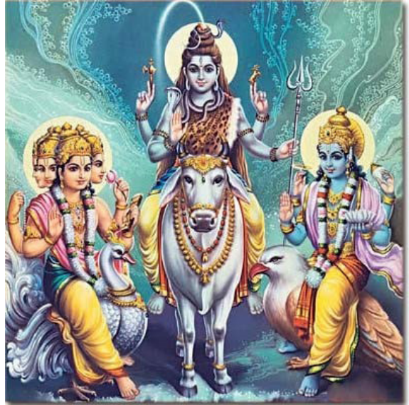
ตรีมูรติ : พระพรหม - พระศิวะ - พระวิษณุ

วัดพระศรีมหาอุมาเทวี ย่านถนนสีลม กรุงเทพมหานคร ศาสนสถานของผู้นับถือศาสนาพราหมณ์ - ฮินดู อายุกว่า ๑๐๐ ปี วัดวิชฌุ เขตยานนาวา กรุงเทพมหานคร เทวสถานแห่งเดียวในเอเชียตะวันออกเฉียงใต้ที่มี เทวรูปศักดิ์สิทธิ์สร้างด้วยหินอ่อน แกะสลักด้วยมือ จากประเทศอินเดีย ครบ ๒๔ องค์ เป็นปราสาทหิน มีปราสาทประธานตามคติจักรวาล ที่มีเขาพระสุเมรุ เป็นศูนย์กลางก็มี เช่น ปราสาทหินพนมรุ้ง บนเทือกเขาพนมรุ้ง อำเภอเฉลิมพระเกียรติ จังหวัด บุรีรัมย์ เทวาลัยของศาสนาฮินดู ลัทธิไศวนิกาย ที่นับถือพระศิวะ หรือพระอิศวรเป็นเทพสูงสุด ปราสาทหินเมืองต่ำ อำเภอประโคนชัย จังหวัด บุรีรัมย์ และปราสาทหินพิมาย ศิลปะขอมโบราณ แบบบาปวน ในอำเภอพิมาย จังหวัดนครราชสีมา เทวาลัยของลัทธิไศวนิกาย เช่นเดียวกับปราสาทหิน พนมรุ้ง ที่น่าตั้งข้อสังเกตก็คือ เทวดาที่จะอัญเชิญ ให้สถิตในโบสถ์พราหมณ์ วัดฮินดู และปราสาท ต่าง ๆ มิใช่เทวดาทั่วไป แต่ต้องเป็นเทพเจ้าหรือเทพ สูงสุด ตามคติความเชื่อของศาสนาพราหมณ์ - ฮินดู เช่น “ตรีมูรติ” ๔ สัญลักษณ์ของการรวมตัวกันของพลัง อันยิ่งใหญ่ของเทพเจ้าในสรรพสิ่งทั้งสามพระองค์ ได้แก่ “พระพรหม” เทพเจ้าที่เป็นสัญลักษณ์แห่งการสร้างโลก