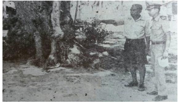
ลุงน้อมฯ ชี้ให้ดูที่ตั้งตำหนักที่ประทับเดิมที่หาดทรายรี

นอกจาก “บันทึกของลุงน้อม” ที่บอกเล่าให้รู้ถึง