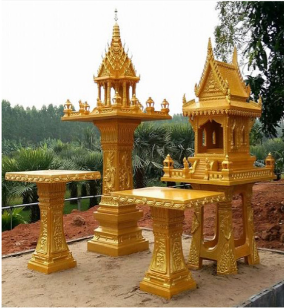
ปูชนียสถาน ศาลพระภูมิ และศาลเจ้าที่

การที่ภูมิปัญญาไทยเรียกปูชนียสถานที่ประดิษฐานรูปเคารพและสัญลักษณ์ของสิ่งศักดิ์สิทธิ์รูปแบบต่าง ๆ เช่น ศาลพระภูมิ ศาลเจ้าที่ ศาลหลักเมือง ใช้เรียกปูชนียสถานที่ประดิษฐานพระบรมรูปปั้น พระบรมรูปหล่อ พระบูรพมหากษัตริย์ เช่น ศาลสมเด็จพระนเรศวรมหาราช ศาลสมเด็จพระเจ้าตากสินมหาราช และเรียกปูชนียสถานที่ประดิษฐานพระรูปหล่อเสด็จในกรมหลวงชุมพรฯ ที่มีจำนวนนับร้อยแห่งทั่วประเทศด้วยคำว่า “ศาล” เหมือนกันหมดนั้นไม่ใช่เพราะภูมิปัญญารู้จักแต่คำว่า “ศาล” เท่านั้น ไม่ใช่เพราะภูมิปัญญาไทยไม่รู้หลักเกณฑ์การใช้คำราชาศัพท์และไม่ใช้เพราะภูมิปัญญาไทยเป็นพวกหัวโบราณ ๙ ไม่ยอมปรับปรุง เปลี่ยนแปลง แต่เป็นเพราะภูมิปัญญาไทยตระหนักในคุณค่าของคตินิยม และขนบธรรมเนียมประเพณีที่ถูกต้องดั่งาม ที่บรรพบุรุษอุตสาหะสั่งมอบเป็นมรดก จึงพยายามรักษาและสืบทอด