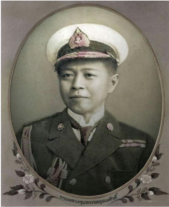
พระรูปถ่ายเสด็จในกรมหลวงชุมพรฯ ในพระตำหนักศาล

หลังจากนั้น ได้มีพิธีถวายพระตำหนักศาล และ อัญเชิญพระรูปถ่ายเสด็จในกรมหลวงชุมพรฯ ประดิษฐาน ไว้เป็นรูปเคารพภายในพระตำหนักศาล เมื่อวันที่อาทิตย์ ที่ ๒๑ มิถุนายน พ.ศ.๒๕๐๒