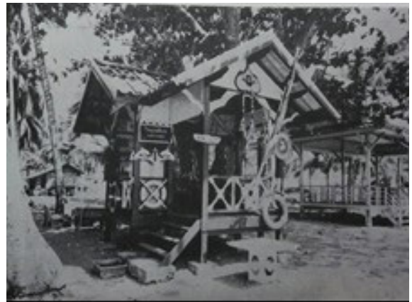
ศาลเสด็จในกรมหลวงชุมพรฯ แหลมปู่เจ้า อำเภอสัตหีบ จังหวัดชลบุรี