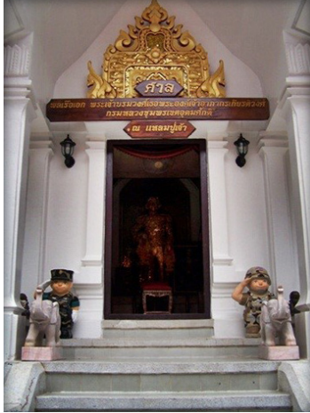
พระรูปหล่อเสด็จในกรมหลวงชุมพราฯ ภายในศาลแหลมปู่เจ้า

จังหวัด ใช้เป็นศูนย์กลางการบริหารงานของจังหวัด เป็นสำนักงานของข้าราชการบริหารด้านการปกครอง ระดับจังหวัด เป็นต้น