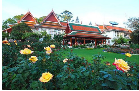
พระตำหนักภูพิงคราชนิเวศน์ จังหวัดเชียงใหม่

ประเด็นที่ควรตั้งข้อสังเกต คือ ทั้ง “ตำหนัก” และ “พระตำหนัก” มีวัตถุประสงค์ของการจัดสร้างที่เหมือนกัน อย่างหนึ่ง คือ “ตำหนัก” สร้างขึ้นเพื่อให้เป็นที่ประทับ ของเจ้านาย และสมเด็จพระสังฆราช “ขณะยังมี พระชนมชีพ” ส่วน “พระตำหนัก” สร้างขึ้นเพื่อให้เป็น ที่ประทับของเจ้านายชั้นสูง หรือพระมหากษัตริย์ “ขณะยังมีพระชนมชีพ” ดังนั้น ในกรณีของ “ตำหนัก” กับ “พระตำหนัก” เสด็จในกรม หลวงชุมพรฯ นี้ แม้จะไม่มีข้อห้ามคำว่า “ตำหนัก” ไปใช้ เรียกชื่อปูชนียสถานที่ประดิษฐานพระบรมรูปปั้น หรือพระบรมรูปหล่อเจ้านายชั้นสูง หรือพระมหากษัตริย์ “ซึ่งเสด็จสวรรคตแล้ว” ๖ หรือพระบูรพมหากษัตริย์ ไว้อย่างชัดเจน แต่ที่ผ่านมาก็ยังไม่มีราชประเพณี