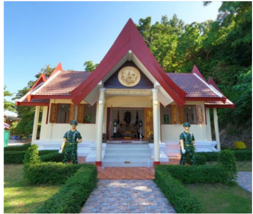
พระตำหนักเสด็จในกรมหลวงชุมพรฯ บนเกาะหลีเป๊ะ จังหวัดสตูล

ทางสื่อสังคมออนไลน์ (Social Media) ปุชนิยมสถานที่ประดิษฐานพระรูปหล่อเสด็จในกรมหลวงชุมพรฯ ที่ใช้คำเรียกชื่อว่า “ตำหนัก” และ “พระตำหนัก” ทั่วประเทศมีจำนวนนับ ๑๐ แห่ง ส่วนใหญ่เรียกว่า “พระตำหนัก” เช่น พระตำหนักเสด็จในกรมหลวงชุมพรฯ ที่หาดทรายรี ตำบลหาดทรายรี อำเภอเมืองชุมพร จังหวัดชุมพร พระตำหนักเสด็จในกรมหลวงชุมพรฯ บนเขาธงชัย ตำบลธงชัย อำเภอบางสะพาน จังหวัดประจวบคีรีขันธ์ พระตำหนักเสด็จในกรมหลวงชุมพรฯ ปากอ่าวมหาชัย วัดศรีสุทธาราม (วัดกำแพง) ตำบลบางหญ้าแพรก อำเภอเมืองสมุทรสาคร จังหวัดสมุทรสาคร พระตำหนักเสด็จในกรมหลวงชุมพรฯ หน่วยบัญชาการต่อสู้อากาศยานและรักษาฝั่ง อำเภอสัตหีบ จังหวัดชลบุรี พระตำหนักเสด็จในกรมหลวงชุมพรฯ เชียงเขาแหลมสิงห์ อำเภอแหลมสิงห์ จังหวัดจันทบุรี พระตำหนักเสด็จในกรมหลวงชุมพรฯ ของหน่วยปฏิบัติการหน่วยบัญชาการต่อสู้อากาศยานและรักษาฝั่ง ๔๙๑ บนเกาะหลีเป๊ะ ตำบลเกาะสาหร่าย อำเภอเมือง จังหวัดสตูล พระตำหนักเสด็จในกรมหลวงชุมพรฯ อำเภอเมือง จังหวัดระยอง พระตำหนักเสด็จในกรมหลวงชุมพรฯ ชายหาดแหลมศอก อำเภอเมือง จังหวัดตราด พระตำหนักเสด็จในกรมหลวงชุมพรฯ