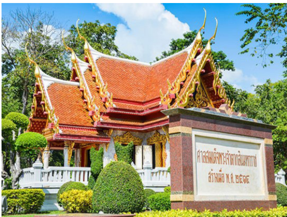
ศาลสมเด็จพระเจ้าตากสินมหาราช อำเภอเมือง จังหวัดตาก

ดังนั้น การที่หน่วยงานราชการ และองค์กรเอกชน นำคำว่า “ตำหนัก” คำราชาศัพท์ที่ใช้เรียกเรือน หรืออาคารที่ประทับของเจ้านาย “ขณะยังมีพระชนมชีพ” ไปใช้เรียกปูชนียสถานที่ประดิษฐานพระรูปหล่อเสด็จในกรมหลวงชุมพรฯ “ซึ่งสิ้นพระชนม์แล้ว” จึงเป็นการกระทำที่ไม่ถูกต้องตามราชประเพณีที่สืบต่อกันมา และการนำคำว่า “พระตำหนัก” ราชาศัพท์ที่ใช้เรียกเรือน หรืออาคารที่ประทับของเจ้านายชั้นสูง หรือพระมหากษัตริย์ไปใช้เรียกปูชนียสถานที่ประดิษฐานพระรูปหล่อเสด็จในกรมหลวงชุมพรฯ พระบรมวงศ์ชั้นพระองค์เจ้า ซึ่งสิ้นพระชนม์แล้ว นอกจากจะเป็นการยกฐานะพระองค์ท่านให้สูงเกินจริงแล้ว ยังเป็นการใช้คำราชาศัพท์ผิดหลักเกณฑ์ ผิดฝาผิดตัว ๙ ไม่ถูกกาลเทศะ อันอาจส่งผลทำให้พระองค์ท่านเสื่อมพระเกียรติ และทำให้เข้าใจฐานะพระองค์ท่านผิดพลาดคลาดเคลื่อนได้