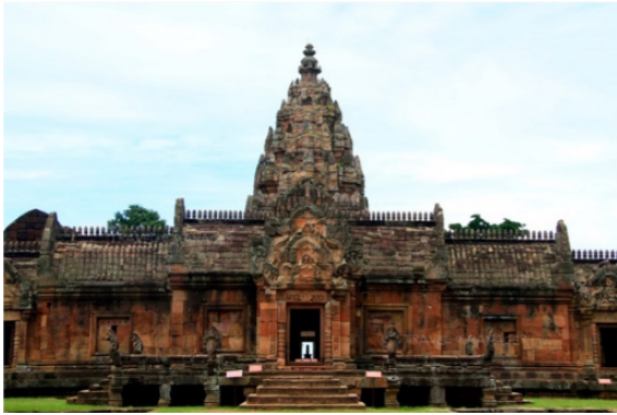
เทวาลัยในศาสนาฮินดูลัทธิไศวนิกายประดิษฐานศิวลึงค์

วัดพระศรีมหาอุมาเทวี ย่านถนนสีลม กรุงเทพมหานคร ศาสนสถานของผู้นับถือศาสนาพราหมณ์ - ฮินดู อายุกว่า ๑๐๐ ปี วัดวิชฌุ เขตยานนาวา กรุงเทพมหานคร เทวสถานแห่งเดียวในเอเชียตะวันออกเฉียงใต้ที่มี เทวรูปศักดิ์สิทธิ์สร้างด้วยหินอ่อน แกะสลักด้วยมือ จากประเทศอินเดีย ครบ ๒๔ องค์ เป็นปราสาทหิน มีปราสาทประธานตามคติจักรวาล ที่มีเขาพระสุเมรุ เป็นศูนย์กลางก็มี เช่น ปราสาทหินพนมรุ้ง บนเทือกเขาพนมรุ้ง อำเภอเฉลิมพระเกียรติ จังหวัด บุรีรัมย์ เทวาลัยของศาสนาฮินดู ลัทธิไศวนิกาย ที่นับถือพระศิวะ หรือพระอิศวรเป็นเทพสูงสุด ปราสาทหินเมืองต่ำ อำเภอประโคนชัย จังหวัด บุรีรัมย์ และปราสาทหินพิมาย ศิลปะขอมโบราณ แบบบาปวน ในอำเภอพิมาย จังหวัดนครราชสีมา เทวาลัยของลัทธิไศวนิกาย เช่นเดียวกับปราสาทหิน พนมรุ้ง ที่น่าตั้งข้อสังเกตก็คือ เทวดาที่จะอัญเชิญ ให้สถิตในโบสถ์พราหมณ์ วัดฮินดู และปราสาท ต่าง ๆ มิใช่เทวดาทั่วไป แต่ต้องเป็นเทพเจ้าหรือเทพ สูงสุด ตามคติความเชื่อของศาสนาพราหมณ์ - ฮินดู เช่น “ตรีมูรติ” ๔ สัญลักษณ์ของการรวมตัวกันของพลัง อันยิ่งใหญ่ของเทพเจ้าในสรรพสิ่งทั้งสามพระองค์ ได้แก่ “พระพรหม” เทพเจ้าที่เป็นสัญลักษณ์แห่งการสร้างโลก