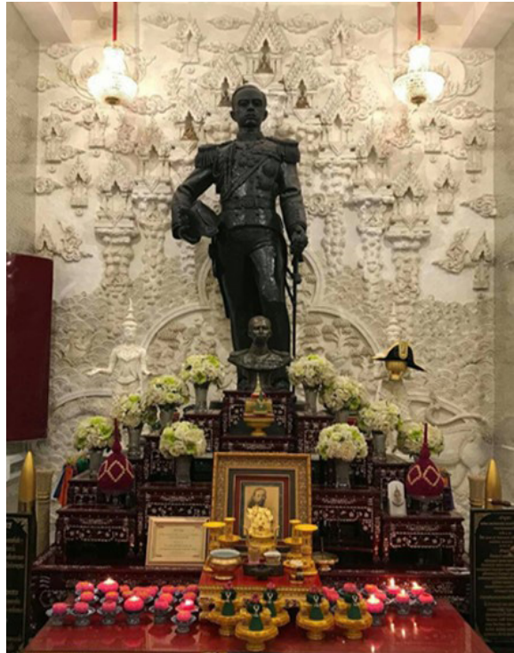
พระรูปหล่อเสด็จในกรมหลวงชุมพรา ในพระวิหารเทวสถิต

“เทวาลัย” และ “พระวิหารเทวสถิต” ทั้งสองคำมีความหมายคล้ายกัน ผู้สร้างมีเจตนาให้เป็นสถานที่ที่ประดิษฐานพระรูปหล่อเสด็จในกรมหลวงชุมพราเหมือนกัน ต่างกันที่ “เทวาลัย” เป็นคำที่ใช้กันทั่วไป ส่วน “พระวิหารเทวสถิต” ในที่นี้เป็นชื่อเฉพาะจากการสืบค้นทางสื่อสังคมออนไลน์ (Social Media) “เทวาลัย” และ “พระวิหารเทวสถิต” มีเพียง ๒ แห่งคือ “เทวาลัยเสด็จในกรมหลวงชุมพรา” ที่ปากน้ำแม่กลอง อำเภอมะกลอง จังหวัดสมุทรสงคราม สร้างเมื่อ พ.ศ. ๒๕๒๙ และ “พระวิหารเทวสถิตเสด็จในกรมหลวงชุมพรา” ของมูลนิธิสรรพราเซนทร์ ตำบลสนามจันทร์ อำเภอมือง จังหวัดนครปฐม ซึ่งอัญเชิญพระรูปหล่อเนื้อสำริด ๓ ขนาดความสูง ๓.๙๐ เมตร ประดิษฐานบนแท่นใน