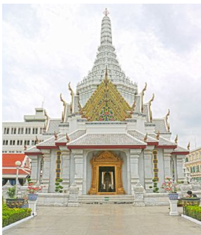
ปูชนียสถานศาลหลักเมืองกรุงเทพมหานคร

๑. ศาล (court) คือ สถานที่ที่ชำระความ และองค์กรที่มีอำนาจพิจารณาพิพากษาอรรถคดีโดย ดำเนินการตามรัฐธรรมนูญ และในพระปรมาภิไธย พระมหากษัตริย์ ได้แก่ ศาลรัฐธรรมนูญ ศาลยุติธรรม ศาลปกครอง ศาลทหาร