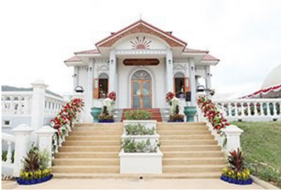
พระตำหนักเสด็จในกรมหลวงชุมพรฯ พลุตาหลวง จังหวัดชลบุรี