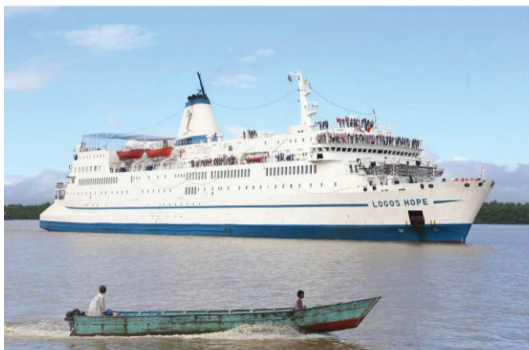
เรือห้องสมุด Logos Hope

๕. ห้องสมุดเฉพาะ เป็นห้องสมุดที่รวบรวมหนังสือและสื่อความรู้ในสาขาวิชาบางสาขาโดยเฉพาะ มักเป็นส่วนหนึ่งของหน่วยราชการ องค์กร บริษัทเอกชน ธนาคาร เป็นต้น ทำหน้าที่จัดหาหนังสือและให้บริการความรู้ ข้อมูล และข่าวสารเฉพาะเรื่องที่เกี่ยวข้องกับการดำเนินงานของหน่วยงานนั้น ๆ