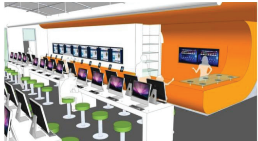
Bookless Library ของคณะวิศวกรรมศาสตร์ จุฬาลงกรณ์มหาวิทยาลัย

การให้บริการเพื่อให้สอดคล้องกับงบประมาณที่ลดลง แต่มีความต้องการใช้บริการเพิ่มขึ้น นอกจากนั้นยังเป็นสถานที่ซึ่งให้คนเข้าถึงอินเทอร์เน็ตและการทำงานคอมพิวเตอร์อย่างมีประสิทธิภาพอีกด้วย ที่สำคัญคือไม่ต้องเสียค่าใช้จ่ายใด ๆ