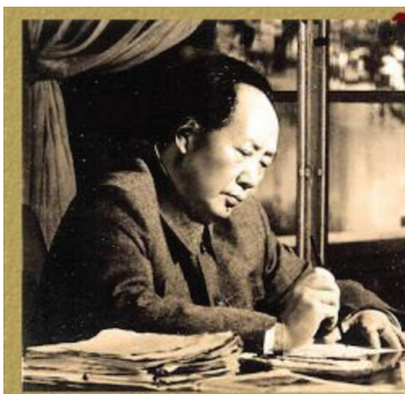
ประธาน เหม่า เจ๋อ ตุง อดีตบรรณารักษ์ห้องสมุด

ในประวัติศาสตร์โลก มีบุคคลจำนวนไม่น้อยที่ห้องสมุดได้มีอิทธิพลต่อความคิดของพวกเขาให้กลายเป็นบุคคลสำคัญของโลก อาจกล่าวได้ว่าถึงกับเปลี่ยนแปลงโลก หรือประเทศของพวกเขา ตัวอย่างเช่น อดีตประธานาธิบดีอับราฮัม ลินคอล์น ของสหรัฐอเมริกา ที่มีบทบาทสำคัญในการเลิกทาส เขาเป็นคนที่ใฝ่หาความรู้ศึกษาด้วยตัวเองจากห้องสมุด