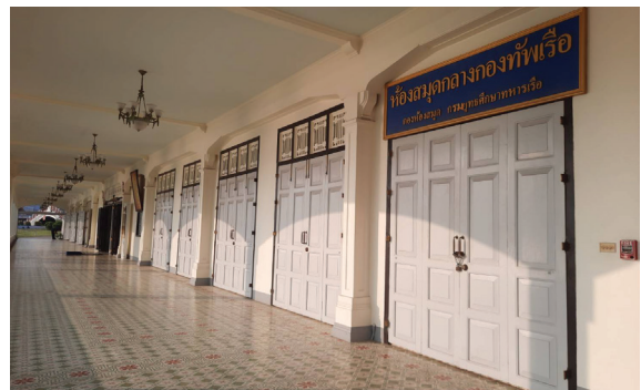
ห้องสมุดกลางกองทัพเรือ

ผู้เขียนได้นำเสนอเรื่องราวเกี่ยวกับแหล่งอาหารสมอง ย้อนไปในประวัติศาสตร์หลายพันปี ซึ่งได้รับการพิจารณาในประเทศต่าง ๆ จนกระทั่งถึงยุคปัจจุบัน คิดว่าผู้อ่านพอจะเห็นความสำคัญของห้องสมุดบ้างไม่น้อย เรามาดูพัฒนาการของแหล่งอาหารสมองของกองทัพเรือ นำภาคภูมิใจที่บรรพบุรุษของเราได้มีวิสัยทัศน์ก่อตั้งห้องสมุดนานกว่าหนึ่งร้อยปี นานกว่าองค์กรต่าง ๆ ทั้งของภาครัฐและเอกชนอื่น ๆ จำนวนมาก แต่เป็นที่น่าเสียดายและรู้สึกหดหู่สำหรับหลายคนที่เคยใช้ประโยชน์จากห้องสมุดแห่งแรก ทั้งเพื่องานราชการและเพื่อส่วนตัว