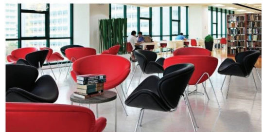
Living Library ของ NIDA

ห้องสมุดลักษณะที่เป็น Bookless ทำนองนี้ปัจจุบันมีหลายประเทศได้นำไปปรับใช้กับห้องสมุดของตน แต่อาจเรียกชื่อแตกต่างกัน ในประเทศไทยมีตัวอย่างให้เห็นที่ห้องสมุดของคณะวิศวกรรมศาสตร์ จุฬาลงกรณ์มหาวิทยาลัย อยู่ที่ชั้นสามของตึกคณะวิศวกรรมศาสตร์ ใช้ชื่อว่า Engineering Library หรือบางคนเรียกว่า Smart Library ใช้เงินสร้าง ๒๕ ล้านบาท ห้องสมุดนี้มีใช่เป็นเพียงห้องอ่านหนังสือ (อิเล็กทรอนิกส์) เท่านั้น แต่ยังมีห้องทำงานเป็นกลุ่มของนักศึกษา เป็นห้องประชุม ห้องพักผ่อนที่มีโซฟา และที่รองขาไว้ให้ผ่อนคลาย มีห้องเฉพาะคนสำหรับทำงานส่วนตัว สำหรับนิสิตของมหาวิทยาลัยไม่ต้องเสียค่าใช้จ่ายใด ๆ