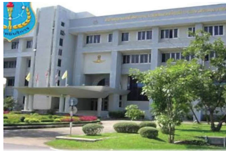
หอสมุดกลางกองทัพอากาศ

จากบทความนี้ใคร่ขอเสนอแนะว่าห้องสมุดกลางกองทัพเรือที่จะสร้างใหม่ น่าจะได้รับการทบทวนเกี่ยวกับสถานที่ ควรจะตอบสนองผู้ใช้ให้สามารถไปใช้บริการได้อย่างสะดวก อย่างเช่น หอสมุดกลางของกองทัพอากาศตั้งอยู่บริเวณดอนเมืองที่มีส่วนราชการของกองทัพอากาศอยู่กันหนาแน่น