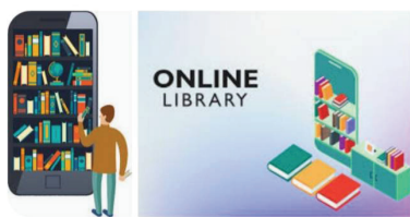
ห้องสมุดดิจิทัล

ห้องสมุดดิจิทัล ห้องสมุด Bibliotech ของรัฐเท็กซัส เป็นห้องสมุดดิจิทัลล้วน ๆ แห่งแรกของโลก ไม่มีหนังสือให้หยิบยืม เพราะมีรูปแบบเป็น E – Books ภายในมีแต่คอมพิวเตอร์ที่ให้บริการ หนังสือในรูปแบบดิจิทัลเป็นรูปแบบที่มีต้นทุนในการบริหารจัดการต่ำกว่าห้องสมุดเดิมที่เต็มไปด้วยหนังสือ ห้องสมุดนี้ใช้คนในการดูแลน้อยกว่า รวมถึงต้องการพื้นที่น้อยกว่า เงินลงทุนสำหรับก่อสร้างห้องสมุดใช้ราว ๗.๕ ล้านบาท เท่านั้น