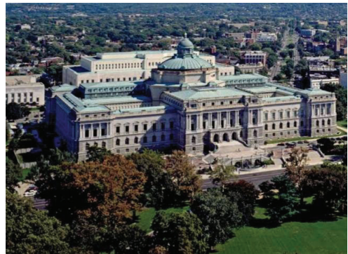
Library of Congress ของสหรัฐอเมริกา

๐.๑ x ๐.๑ เซนติเมตร ต้องใช้ปลายเข็มในการเปิด