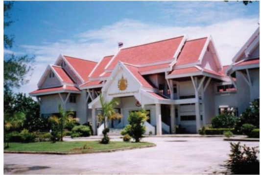
หอสมุดแห่งชาติ

ประเภทของห้องสมุด ห้องสมุดที่ให้บริการในประเทศไทยโดยทั่วไปแบ่งตามลักษณะ หน้าที่ และวัตถุประสงค์ของการให้บริการได้ ๕ ประเภท คือ