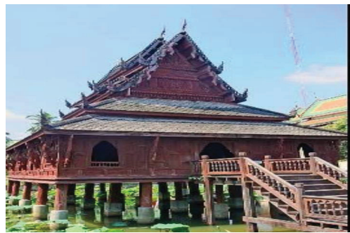
หอพระมณเฑียรธรรม

ห้องสมุดแห่งแรกของไทย พัฒนาการของห้องสมุดในประเทศไทยมีมาตั้งแต่สมัยสุโขทัย โดยมีการเก็บคัมภีร์พระไตรปิฎก ซึ่งจารึกลงบนใบลานไว้ที่ “หอไตร หรือหอพระไตรปิฎก” ในวัด อารามต่าง ๆ (วัดที่อยู่ในเมืองหรือคามวาสี) นอกจากนั้นยังมีการจัดเก็บหลักศิลาจารึกและวรรณกรรมทางศาสนาโดยเฉพาะอีกด้วย