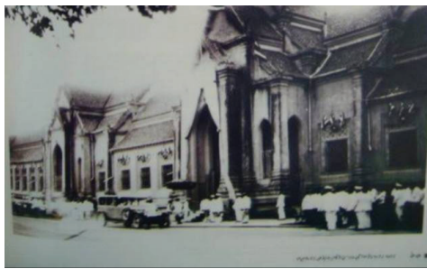
หอสมุดวชิรญาณ

มีกรรมการ สมาชิกต้องเสียค่าใช้จ่ายเป็นค่าบำรุง นอกจากนี้ยังโปรดให้สร้าง “หอพระพุทธศาสนาสังคหะ” เพื่อเก็บพระไตรปิฎกและหนังสืออื่น ๆ ต่อมาได้พระราชทานชื่อใหม่ว่า “หอสมุดวชิรญาณสำหรับพระนคร” ซึ่งถือว่าเป็นรากฐานการให้บริการแก่ผู้ใช้อย่างทั่วถึง ต่อมาห้องสมุดได้นำระบบคอมพิวเตอร์เข้ามาช่วยงานของห้องสมุดเป็นครั้งแรกที่สถาบันเทคโนโลยีแห่งเอเชีย (Asian Institute of Technology – AIT) เมื่อปี พ.ศ. ๒๕๑๙