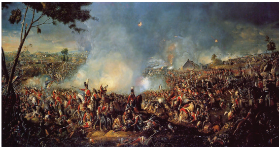
สงครามนโปเลียน

ปิดอ่าวที่ฐานทัพเบรสต์และตุลอง ถูกกำลังทางเรือยึด เกาะคอร์ซิกา กำลังทางเรือผสมฝรั่งเศส - สเปนแพ้ที่แหลม เซนต์วินเซนต์ แพ้ที่อ่าวอาบูกีร์ ถูกอังกฤษปิดอ่าวที่เกาะ มอลตาที่ปากอ่าวแม่น้ำไนล์ และที่สำคัญที่สุดแพ้ในวันที่ ๒๑ ตุลาคม ค.ศ. ๑๘๐๕ ในการยุทธที่ทราฟัลการ์ ซึ่งกองทัพเรืออังกฤษเป็นกองทัพที่ยิ่งยงที่สุด และเป็น หัวหอกในการสร้างจักรวรรดิอังกฤษที่ - ดวงอาทิตย์ไม่มี วันตกดิน ในเวลาต่อมา