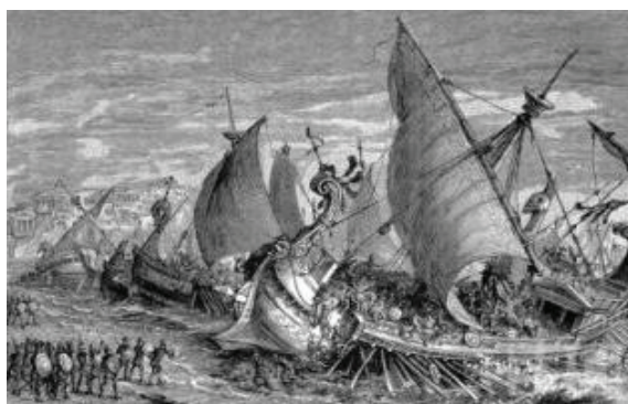
สงครามเพโลพอนเนซุส

ในปี ๔๒๙ ก่อนคริสตกาล ฝ่ายเอเธนส์ได้รับชัยชนะในการยุทธทั้ง ๒ ครั้ง โดยการนำทัพของฟอรัมิโอที่ได้อีกว่าเป็นแม่ทัพเรือคนเก่งรายแรกของโลก