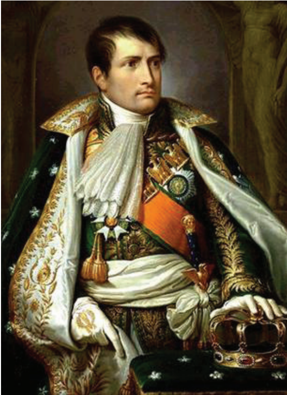
นโปเลียน โบนาปาร์ต (Napoleon Bonaparte) มหาจักรีแห่งฝรั่งเศสผู้ขยายอำนาจไปทั่วยุโรป