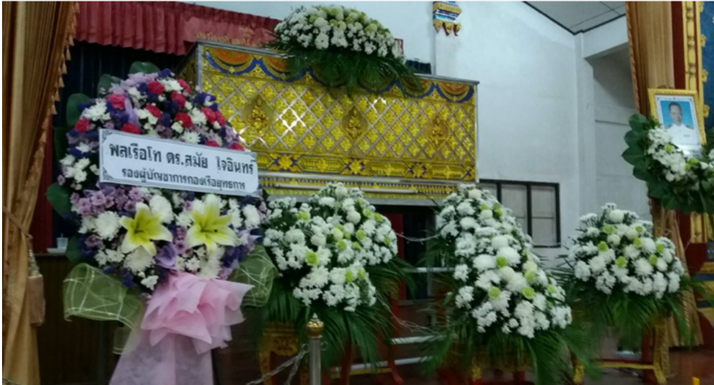
หีบบรรจุศพ เรือตรี ประกอบ เหลืองอร่าม ก่อนขอไฟพระราชทาน และเครื่องเกียรติยศประกอบศพ

แล้วกำหนด “ข้อบังคับกระทรวงกลาโหมฯ (ฉบับที่ ๒) พ.ศ. ๒๕๑๓” และ (ฉบับที่ ๓) พ.ศ. ๒๕๒๖” ใช้บังคับตามลำดับจนถึงปัจจุบัน กระทรวงกลาโหมได้กำหนด “ข้อบังคับกระทรวงกลาโหม ว่าด้วยการจัดกองทหารเกียรติยศ พ.ศ. ๒๕๒๘” ใช้เป็นหลักปฏิบัติฉบับล่าสุด