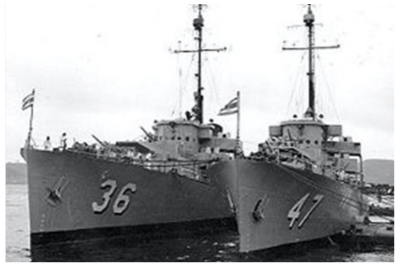
เรือหลวงท่าจีน ลำที่ ๒ (๓๖) และเรือหลวงประแส ลำที่ ๒ (๔๗)

และเรือหลวงสีซิง ไปสมทบกับกองเรือเฉพาะกิจที่ ๙๕ ของสหประชาชาติ เรือหลวงประแส และเรือหลวงบางปะกงได้แสดงศักยภาพในการปฏิบัติหน้าที่เป็นเรือคุ้มกัน ลำเลียงทหารไทย การตรวจ และรักษาต๋านเข้าต่อตีเรือดำน้ำ ระดมยิงฝั่งต่อที่ตั้งกองทหารที่ตั้งปืนใหญ่ อุปกรณ์ในการขนส่ง และส่งกำลังบำรุง