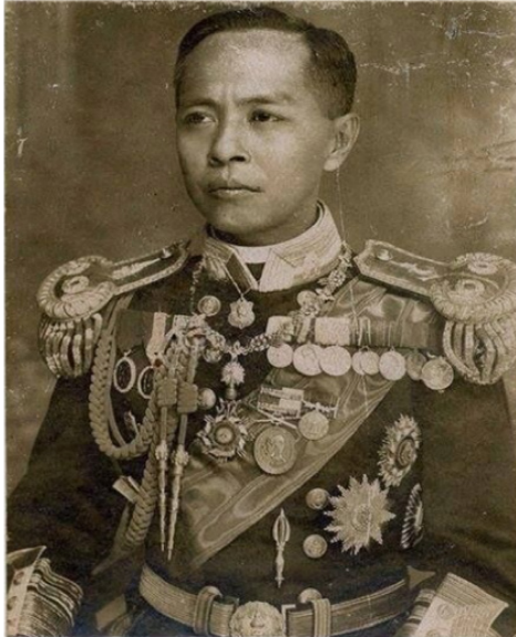
พลเรือเอก พระเจ้าบรมวงศ์เธอ พระองค์เจ้าอาภากรเกียรติวงศ์ กรมหลวงชุมพรเขตอุดมศักดิ์