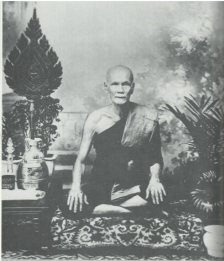
พระธรรมถาวร (ช่วง จันทโชติ)

๔. ให้กองพันจัดทหาร และแตรเป็นกองเกียรติยศ ไปเผา และเคารพศพเวลาเผา