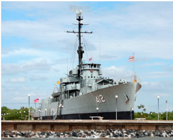
อนุสรณ์เรือหลวงประแส ลำที่ ๒ บริเวณปากน้ำประแสร์ จังหวัดระยอง

เมื่อกลับจากการปฏิบัติราชการสงครามประเทศ เกาหลีแล้ว เรือตรี ประกอบ เหลืองอร่าม ก็ยังได้รับ