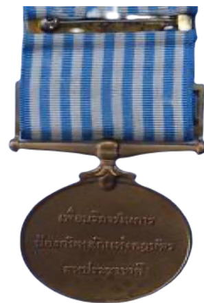
เหรียญปฏิบัติงานสหประชาชาติ (เกาหลี) ด้านหลัง