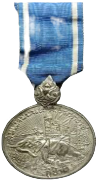
เหรียญชัยสมรภูมิสงครามร่วมกับสหประชาชาติ ณ ประเทศเกาหลี

ไปปฏิบัติราชการแทนเรือหลวงประแส ลำที่ ๑ และ เรือหลวงบางปะกง เรือตรี ประกอบ เหลืองอร่าม ซึ่งครองยศจ่าโทในขณะนั้นได้รับคำสั่งให้เป็นกำลังพล ประจำเรือหลวงประแส ลำที่ ๒ ไปปฏิบัติราชการสงคราม ร่วมกับสหประชาชาติ ณ ประเทศเกาหลี ตั้งแต่วันที่ ๑๑ กรกฎาคม พ.ศ. ๒๔๙๕ ถึงวันที่ ๒๗ มีนาคม พ.ศ. ๒๔๙๖