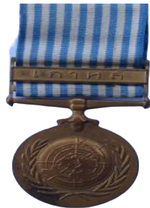
เหรียญปฏิบัติงานสหประชาชาติ (เกาหลี) ด้านหน้า