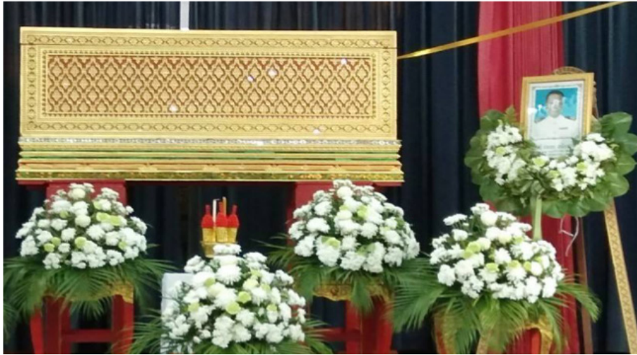
หีบลายก้านแย่งเครื่องเกียรติยศประกอบศพ เรือตรี ประกอบ เหลืองอร่าม

ในการจัดการศพ เรือตรี ประกอบ เหลืองอร่าม อดีตทหารผ่านศึกกรณีสงครามร่วมรบกับสหประชาชาติ ณ ประเทศเกาหลี ที่วัดป่ายุบ ตำบลสตึก อำเภอสตึก จังหวัดชลบุรี เมื่อวันที่ ๑๓ พฤษภาคม พ.ศ. ๒๕๖๔ แม้เหตุการณ์จะเกิดหลังจากงานศพ เรือตรี แพ เป็นเวลานานถึง ๙๙ ปี แต่ทั้ง ๒ กรณีกลับมีส่วนคล้ายกัน