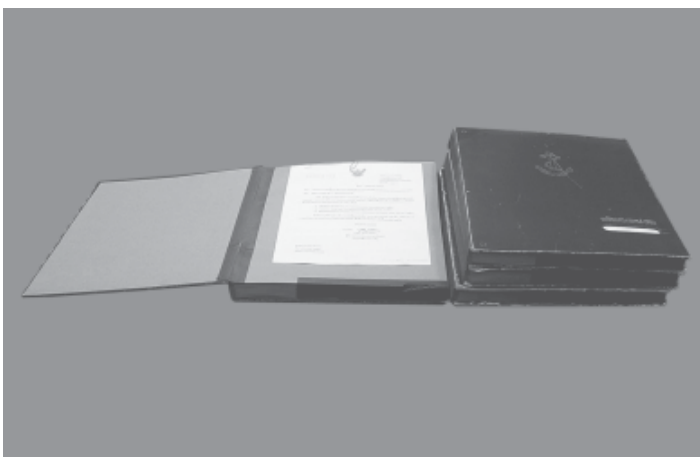
แฟ้มเสนองาน