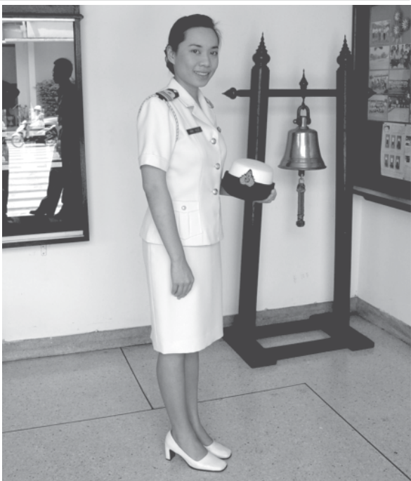
นายธงเจ้ากรมการเงินทหารเรือ