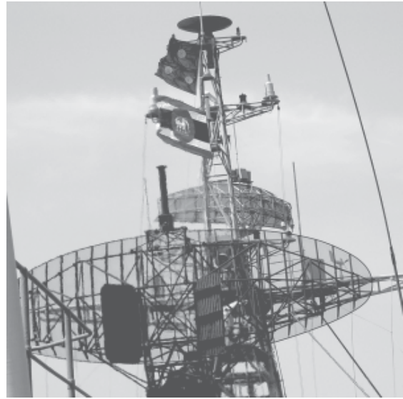
ธงเครื่องหมายศพลเรือโท

งานใดที่นายได้รับเกียรติให้กล่าวคำอวยพร สุนทรพจน์ ก่อนไปร่วมงานนายจงต้องร่างคำกล่าว ให้นายอ่าน และตรวจสอบเสียก่อน เมื่อนายเห็น ชอบและได้แก้ไขแล้ว ควรจัดพิมพ์ใหม่ให้เรียบร้อย อ่านได้ง่าย ๆ ตัวอักษรโต อ่านไม่ต้องใช้แว่นได้ยั้งดี คำกล่าวที่ใช้สำหรับงานพิธีต่าง ๆ นั้น ท่านสามารถ หาตัวอย่างได้จากหนังสือในห้องสมุด