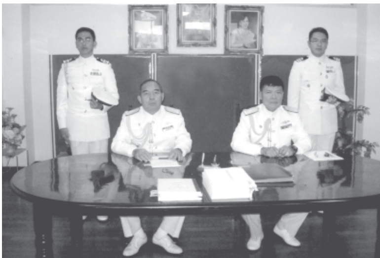
พิธีส่งมอบหน้าที่ เจ้ากรมอิเล็กทรอนิกส์

ที่มาของคำว่า “นายธง” ซึ่งใช้กันในกองทัพเรือ ในความหมายของ ADC นั้น ในทัศนะส่วนตัวแล้ว คิดว่า น่าจะมาจากคำว่า “Flag Lieutenant” ซึ่งหมายถึงนายทหารที่ได้รับการแต่งตั้งให้ดูแลและช่วยเหลือนายพลเรือ (Flag Officer - ในยุคเรือใบ นายพลเรือจะมีธงตำแหน่งของตนชักขึ้นบนยอดเสา จึงเรียกนายทหารชั้นนายพลเรือว่า Flag Officer) ส่วนบางคนอ้างว่ามีที่มาตั้งแต่สมัยยุคเรือใบที่นายทหารคนสนิทของผู้บังคับบัญชา คอยกำกับดูแลเรื่องสัญญาณธงแทนนายนั้น ก็มีเหตุผลน่ารับฟังแต่ผู้เขียนยังไม่เคยพบหลักฐานดังกล่าว หากใครมีหลักฐาน (ของฝรั่ง) กรุณาช่วยบอกด้วย จักขอบพระคุณเป็นอย่างสูง