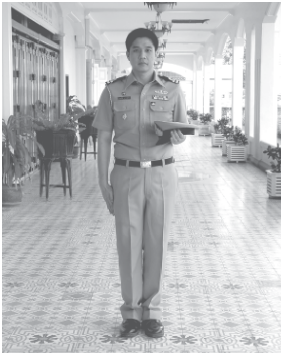
นายธงของผู้บังคับบัญชาระดับสูง

นำเรื่อง คำว่า “นายธง” เป็นชื่อที่ใช้เรียกกันเฉพาะในวงการทหารเรือ เหล่าทัพอื่นเรียกแตกต่างกันไปเป็น “นายทหารคนสนิท” ได้พยายามค้นคว้าว่าตำแหน่งนี้เริ่มเรียกกันตั้งแต่เมื่อใดแต่ก็ไม่ทราบชัดเจนนัก ถ้าหากไม่คิดเฉพาะในวงการทหารแล้ว ตำแหน่งหรืองานในลักษณะทำนองเดียวกับนายธงนั้นมีมานานนับเป็นพัน ๆ ปี ที่พวกเราทราบดีก็คือ พุทธอุปัฏฐากของพระสัมมาสัมพุทธเจ้าที่มีนามว่าพระอานนทนั้นเอง รายละเอียดบางประการที่คนทำหน้าที่นายธงควรน้อมรับมาเป็นแบบอย่างจะกล่าวในอันดับต่อไป