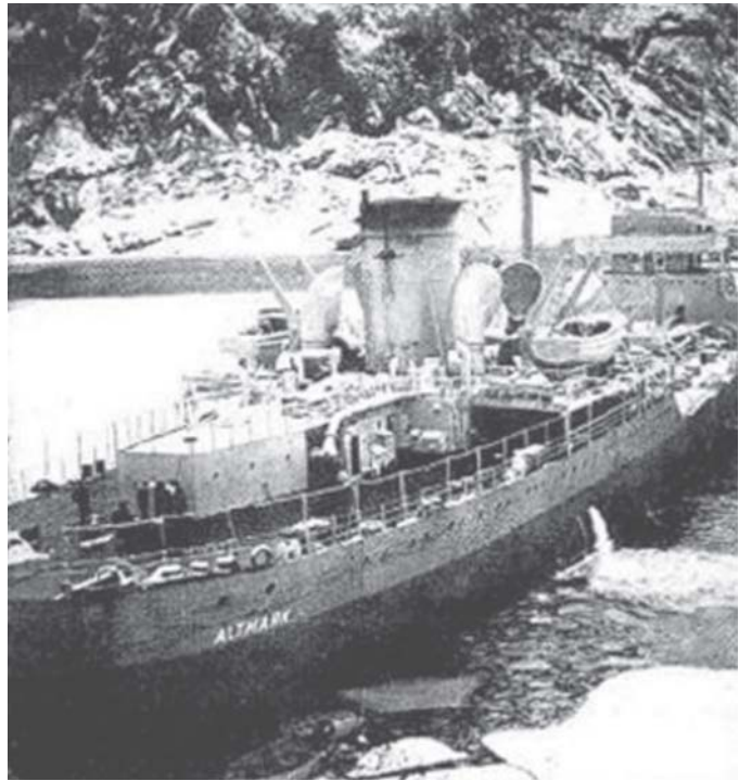
เรือ Altmark ถูกเรือรบอังกฤษ HMS Cassak จับกุมในน่านน้ำนอร์เวย์

เหตุการณ์ในสงครามโลกครั้งที่สอง เมื่อเรือรบของอังกฤษ HMS Cassak เสี่ยงเข้าไปในน่านน้ำที่เป็นกลางของ นอร์เวย์ เพื่อปลดปล่อยนักโทษที่ถูก จับกุมไว้ในเรือ Altmark ของเยอรมนี เมื่อกุมภาพันธ์ ค.ศ. ๑๙๔๐ กรณีนี้ นับว่าเป็นตัวอย่างแบบคลาสสิกทางการ ทูตเรือปืนในการใช้กำลังรบทางเรือ อย่างเฉพาะเจาะจง โดยการใช้กำลัง รบทางเรืออย่างจำกัดและพอประมาณ ซึ่งประสบความสำเร็จด้วยดี (ใน สายตาของอังกฤษ) บทเรียนที่ได้รับ สอนให้เรารู้ว่า ความรุนแรงใด ๆ ที่ สามารถจำกัดหรือควบคุมได้ทั้งใน มิติของเวลาและสถานที่แล้ว จะ ช่วยเสริมให้ลักษณะของการ ปฏิบัติอยู่ในระดับที่จำกัด อีกกรณี หนึ่งที่พวกเรารู้จักกันดี คือ เมื่อ อาร์เจนตินาเข้ายึดหมู่เกาะ Falkland/ Malvinas จากอังกฤษในการปฏิบัติการ “Rosario” เมื่อ ค.ศ. ๑๙๘๒ แต่ กรณีนี้ยุติลงด้วยความหายนะของ อาร์เจนตินา เพราะว่าเหนือไม่ ได้อ่อนแอและไร้ศักดิ์ศรี อังกฤษ ได้เลือกตอบโต้โดยขยายความ ขัดแย้งไปสู่การทำสงคราม อย่างไรก็ตาม เมื่อมีเงื่อนไขถูก ต้องและสมควร การใช้กำลังรบ ทางเรือประเภทนี้มักจะเป็นวิธีที่ ใช้การทูตเรือปืนได้อย่างมี ประสิทธิภาพมากประเภทหนึ่ง