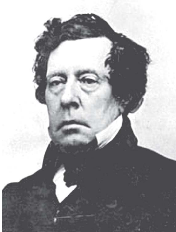
พลเรือจัตวา Perry ผู้เปิดประตูญี่ปุ่นเมื่อ ค.ศ. ๑๘๕๔

ก่อนแอดก้านกำลังรบทางเรือของญี่ปุ่น จึงจำต้องยอมรับสนธิสัญญาคานากาวา (The Treaty of Kanagawa) ที่ทำกันเสร็จสมบูรณ์เมื่อปลายมีนาคม ค.ศ. ๑๘๕๔ ตามที่สหรัฐ ฯ เป็นฝ่ายเสนอ พร้อมกับให้เปิดท่าเรือ Shimoda กับ Hakodate ให้แก่สหรัฐ ฯ