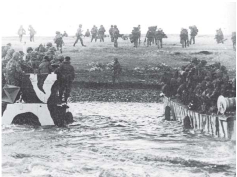
ภาพจากสงคราม Falkland