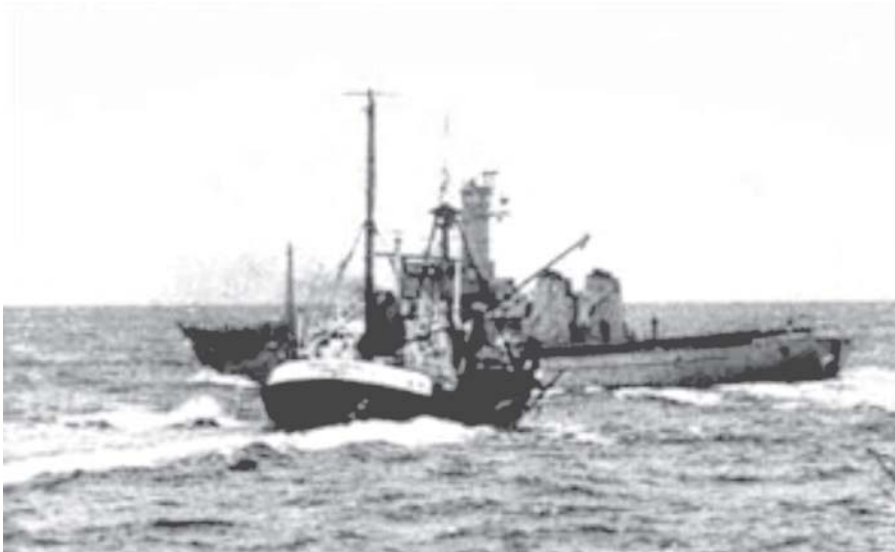
ความขัดแย้งระหว่างอังกฤษกับไอซ์แลนด์ที่เรียกกันว่า Cod War

๒. กำลังรบที่มีเจตนาชัดเจน (Purposeful Force) การใช้กำลังรบประเภทนี้มีความมุ่งหมายพยายามชักนำให้เสียการทำการบางอย่าง (หรือไม่คิดที่จะกระทำ) หรือระงับการกระทำที่ได้ดำเนินการไปแล้ว เป็นวิธีการที่มีความเชื่อถือได้ และการใช้โดยตรงน้อยกว่าการใช้กำลังประเภทแรก เนื่องจากความสำเร็จขึ้นอยู่กับ การตัดสินใจของเหยื่อว่าจะตอบโต้อย่างไรภายใต้ความกดดัน เป็นวิธีการที่มีความเสี่ยงสูงดัง “การดับไฟด้วยไฟ” และความเสี่ยงจะยิ่งเลวร้ายมากขึ้น ถ้าทั้งสองฝ่ายมีความเข้มแข็งทางทหารเกือบเท่าเทียมกัน แต่ในบางกรณีขนาดของกำลังรบทางเรือที่นำไปใช้ของทั้งสองฝ่ายเป็น ประเด็นสำคัญน้อยกว่าแรงขับเคลื่อนทางการเมือง เช่น กรณีของความขัดแย้งระหว่างอังกฤษกับไอซ์แลนด์ ได้เริ่มตั้งแต่